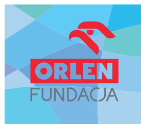
tła o mocnej ornamentyce zaburzającej czytelność