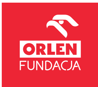
biały Znak na czerwonym tle