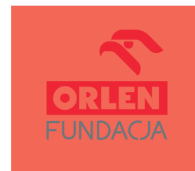
tła o małym kontraście względem znaku